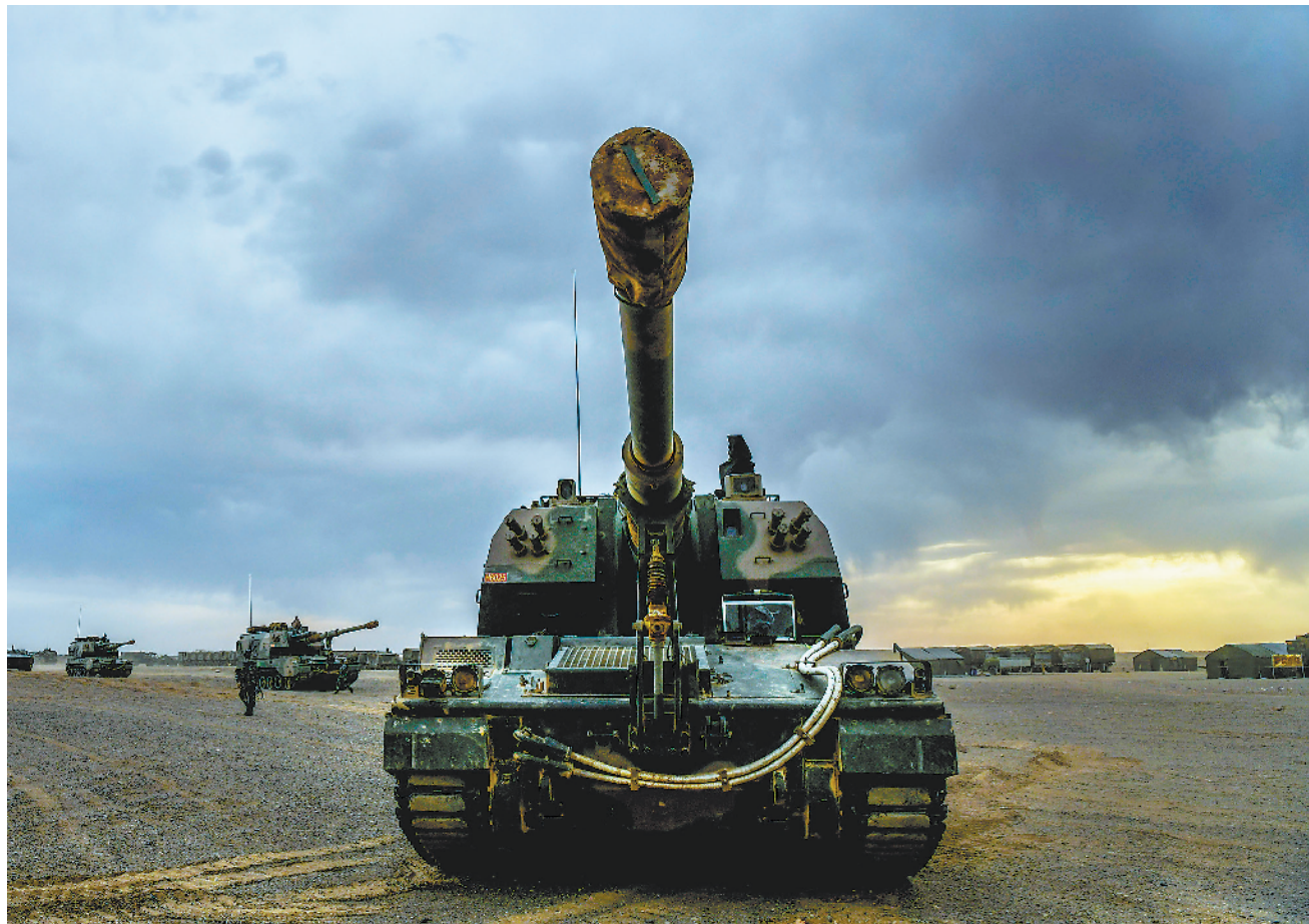
6月上旬，第74集团军某旅组织战场机动演练，锤炼部队快速反应能力。

救援分队赶到琼勒勒达坂时，已是22时30分。当发动机轰鸣声刺破高原夜幕，被困4个多小时的巡逻官兵顿时欢呼起来。经过共同努力，次日凌晨3时许，官兵终于安全返营。