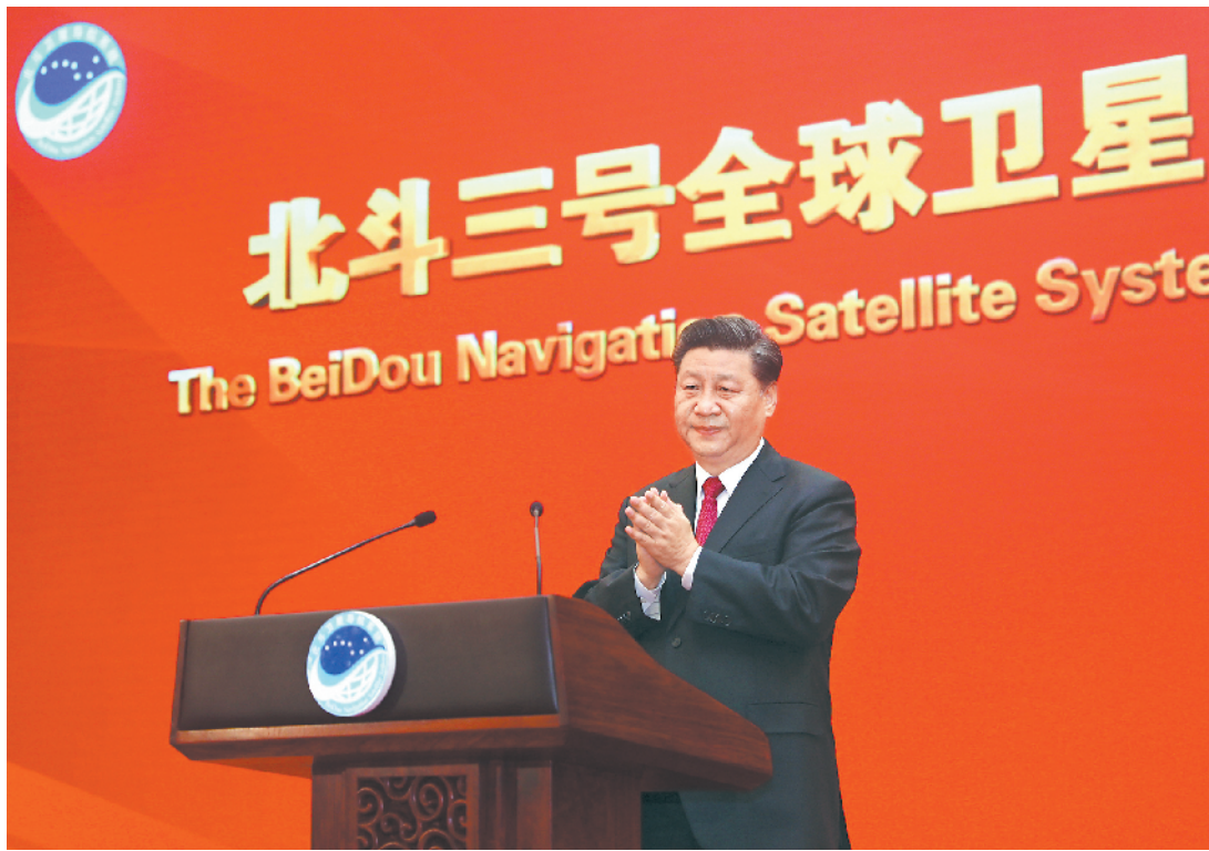
7月31日上午，北斗三号全球卫星导航系统建成暨开通仪式在北京举行。中共中央总书记、国家主席、中央军委主席习近平出席仪式，宣布北斗三号全球卫星导航系统正式开通。

●北斗三号全球卫星导航系统的建成开通，充分体现了我国社会主义制度集中力量办大事的政治优势，对提升我国综合国力，对推动疫情防控常态化条件下我国经济发展和民生改善，对推动当前国际经济形势下我国对外开放，对进一步增强民族自信心、努力实现“两个一百年”奋斗目标，具有十分重要的意义。26年来，参与北斗系统研制建设的全体人员迎难而上、敢打硬仗、接续奋斗，发扬“两弹一星”精神，培育了新时代北斗精神，要传承好、弘扬好。要推广北斗系统应用，做好确保系统稳定运行等后续各项工作，为推动我国经济社会发展、推动构建人类命运共同体作出新的更大贡献