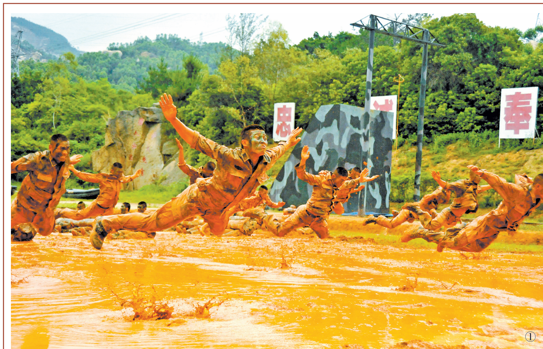
图①:集训队队员进行泥潭障碍训练。 图②:集训队队员进行机降训练。 图③:集训队队员进行潜水训练。

在基层部队,各种集训、短期培训不少。这些集训往往都会从各单位抽调部分骨干组训、参训,长则大半年,短则一