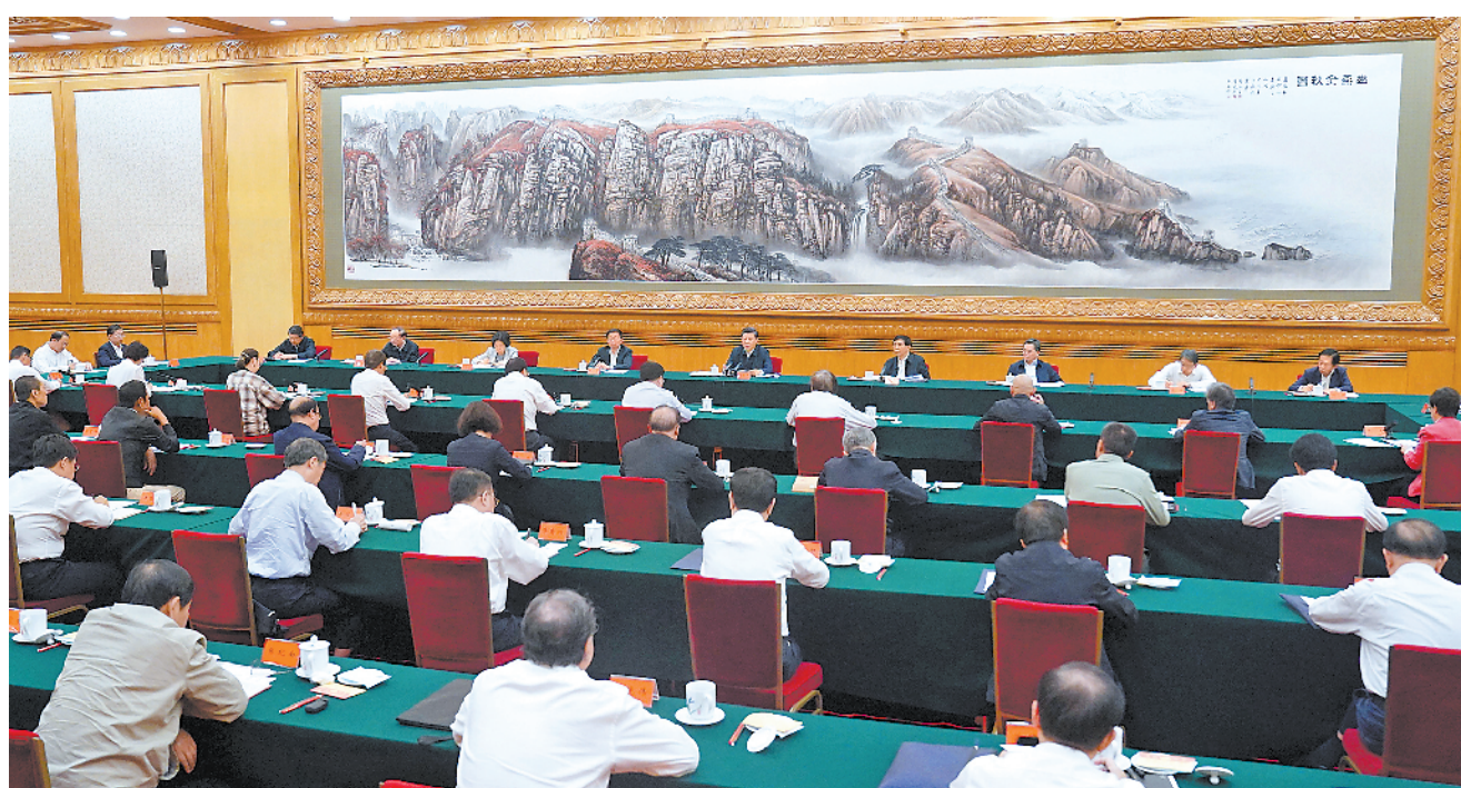
9月22日,中共中央总书记、国家主席、中央军委主席习近平在京主持召开教育文化卫生体育领域专家代表座谈会并发表重要讲话,就“十四五”时期经济社会发展听取意见和建议。