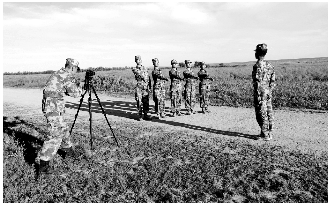
近日，第80集团军某旅组织新训骨干考核。考核期间全程录像监督，严肃考风考纪，严把考核质量。