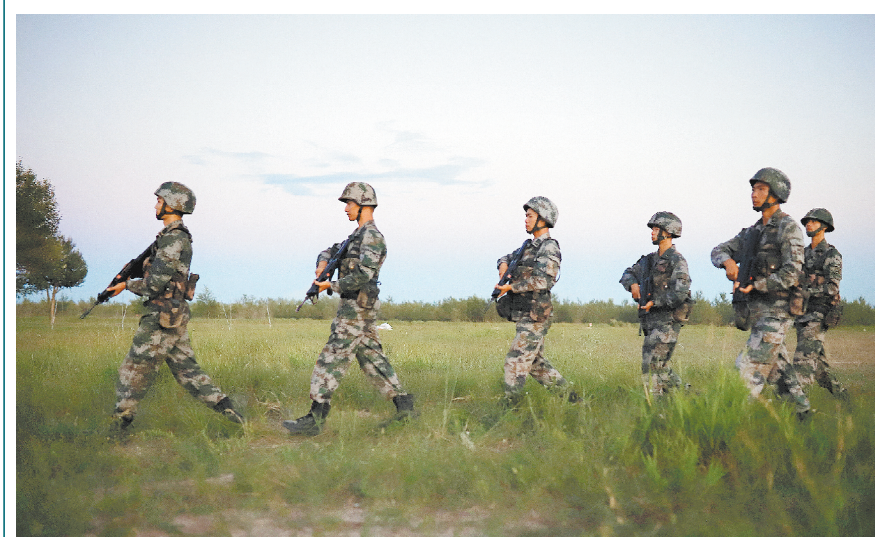
北部战区某旅组织官兵对各个执勤点位进行武装巡逻。