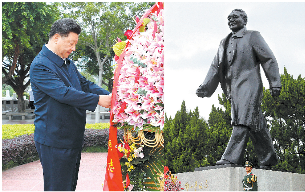
十月十四日,深圳经济特区建立四十周年庆祝大会在广东省深圳市隆重举行。中共中央总书记、国家主席、中央军委主席习近平在会上发表重要讲话。这是当天下午,习近平来到莲花山公园,向邓小平同志铜像敬献花篮。