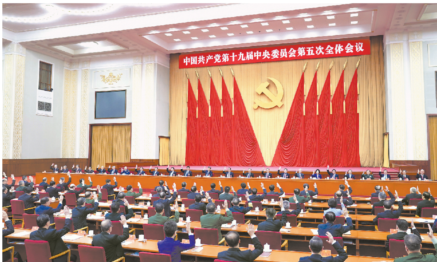
中国共产党第十九届中央委员会第五次全体会议,于2020年10月26日至29日在北京举行。中央政治局主持会议。