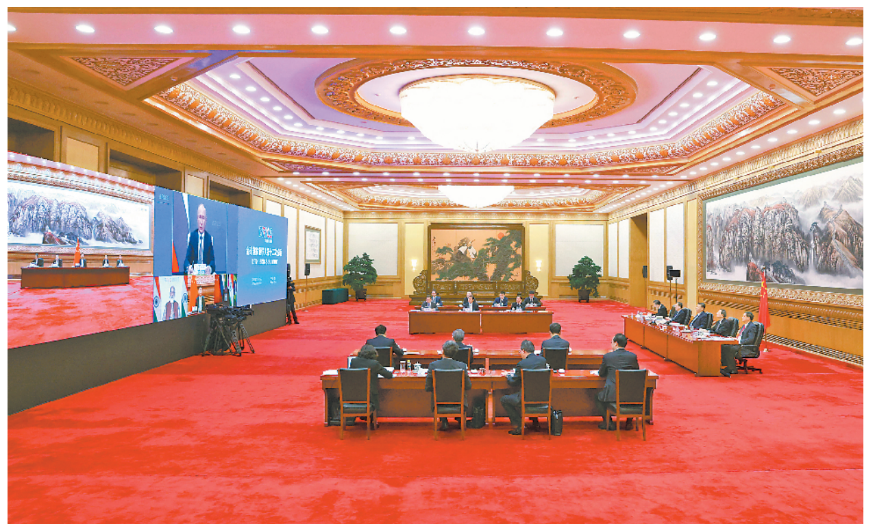
十一月十七日晚,金砖国家领导人第十二次会晤以视频方式举行。国家主席习近平在北京出席会晤并发表重要讲话。

新华社北京11月17日电 金砖国家领导人第十二次会晤17日晚以视频方式举行。俄罗斯总统普京主持,中国国家主席习近平、印度总理莫迪、南非总统拉马福萨、巴西总统博索纳罗出席。