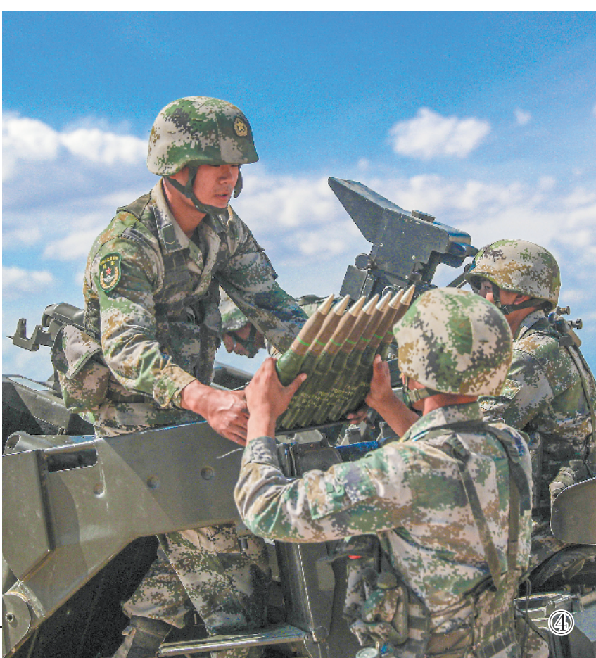
图①：高炮分队对低空来袭“敌”机实施打击。 图②：打击摧毁“敌”方阵地。 图③：侦察分队向“敌”侧翼迂回。 图④：官兵协力装填弹药。 图⑤：向目标地域快速机动。

演习中，官兵克服风沙大、夜暗环境等不利因素影响，着力锤炼作战指挥、战术协同、战场保障及精确打击能力，较好地破解了战斗协同不到位、战场感知不清晰等短板弱项。