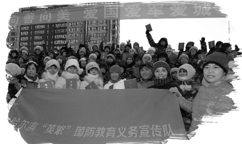
黑龙江省哈尔滨市“英繁”国防教育义务宣传队走街串巷宣传国防知识。

黑龙江省将每年9月确定为“国防教育月”。在“国防教育月”,全省组织国防教育授课会操,成果展示、研讨交流等活动,教员上讲台、经验上展台、领导上讲台,通过展示交流让一堂授课普惠全员、一家经验众人收获、一个难题大家攻关。