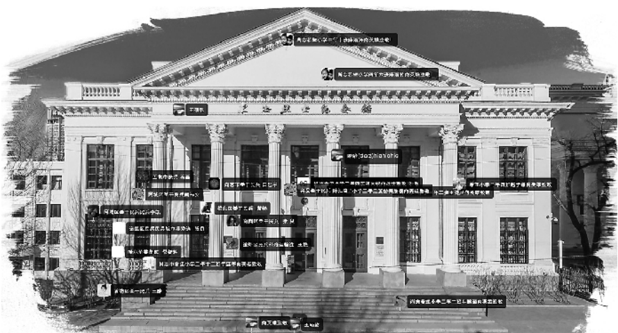
东北烈士纪念馆创新展陈形式,为参观者提供网络观展服务。图为纪念馆云展馆网络截图

他们还发挥网络优势,实现教育资源共享。记者点击该省国防教案课件库看到,有的教案直击领导干部的思想困惑点,有的教案触及普通群众的情感共鸣点,有的教案填补青年学生的知识空