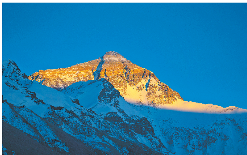
8848.86米! 珠穆朗玛峰最新身高12月8日公布,而且仍在不断增长。图为珠峰晚霞。