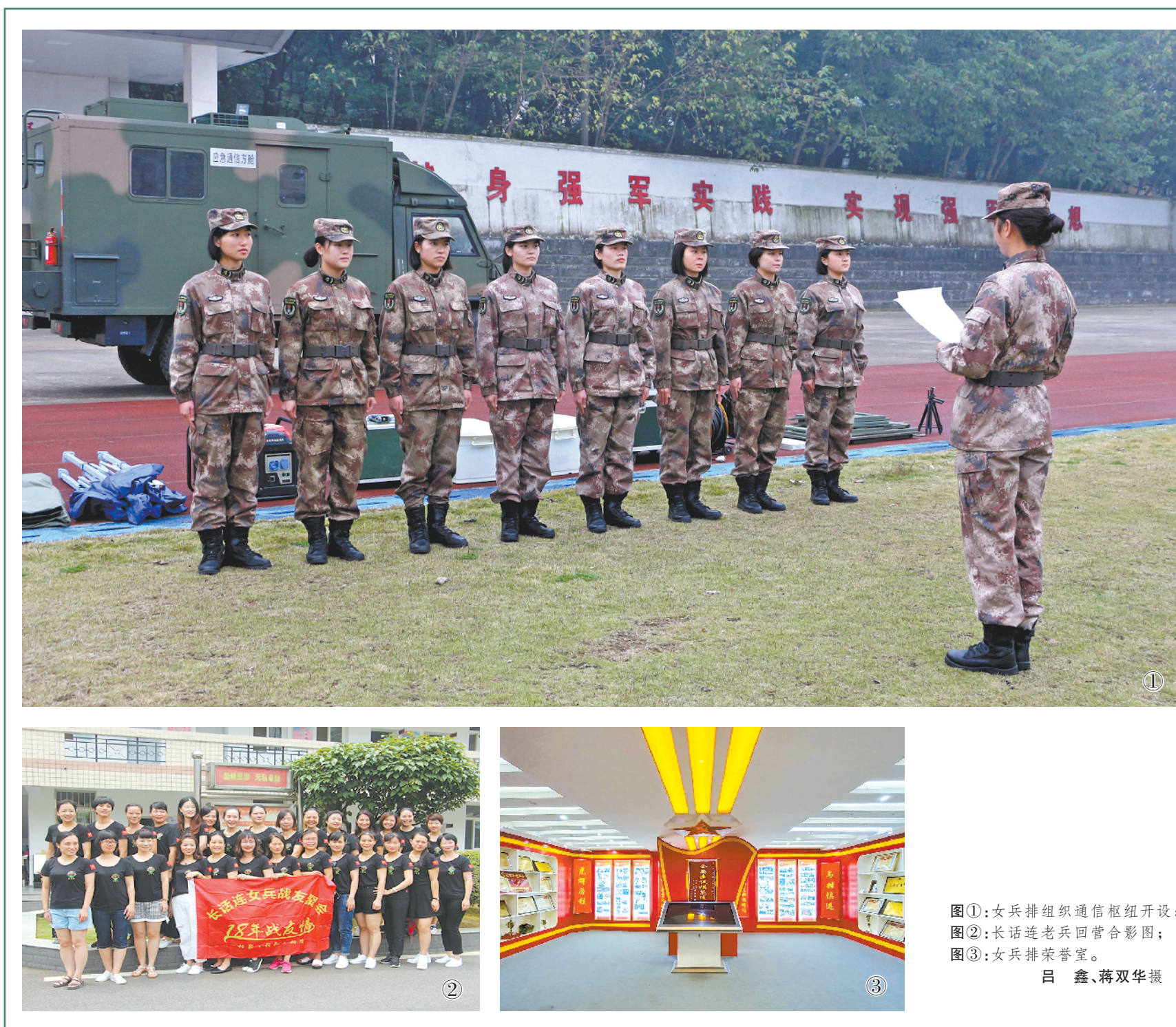
图①:女兵排组织通信枢纽开设; 图②:长话连老兵回营合影; 图③:女兵排荣誉室。