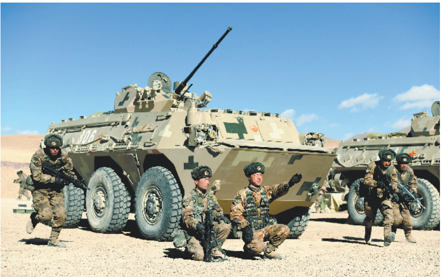
新疆军区某师合成团在高原驻训地组织协同演练。

针对基层政工干部在演训活动中参与度低的现象,要善于创新方式方法,变“条件不允许没法干”为“立足实际想办法干”,主动在大项任务中淬炼历练,成为把政治工作当本职、军事训练当本分的“双料行家手里”,切实提高服务练兵备战的质量效益。