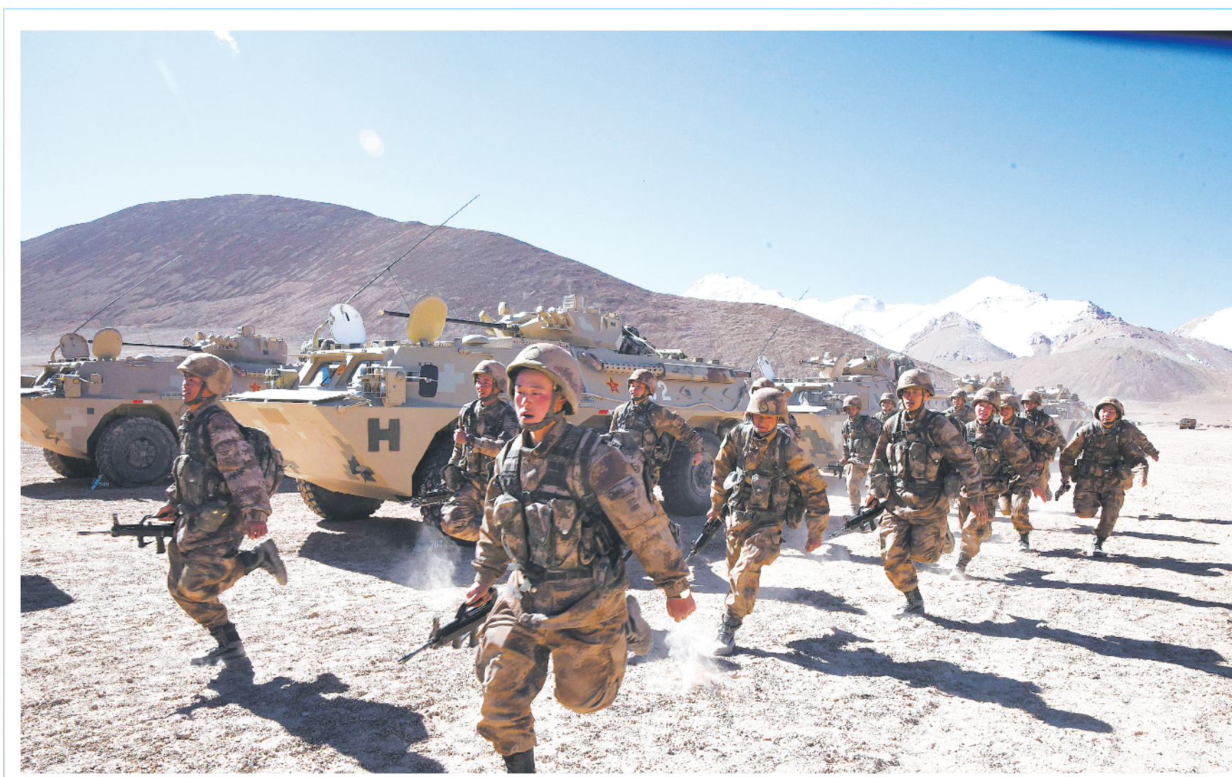
高原陌生地域,新疆军区某师合成团进行应急出动演练。

与度很高,可就是效果不理想。有的官兵说,参与起来很开心,就是很难走心;活动有滋有味,就是缺少战味。