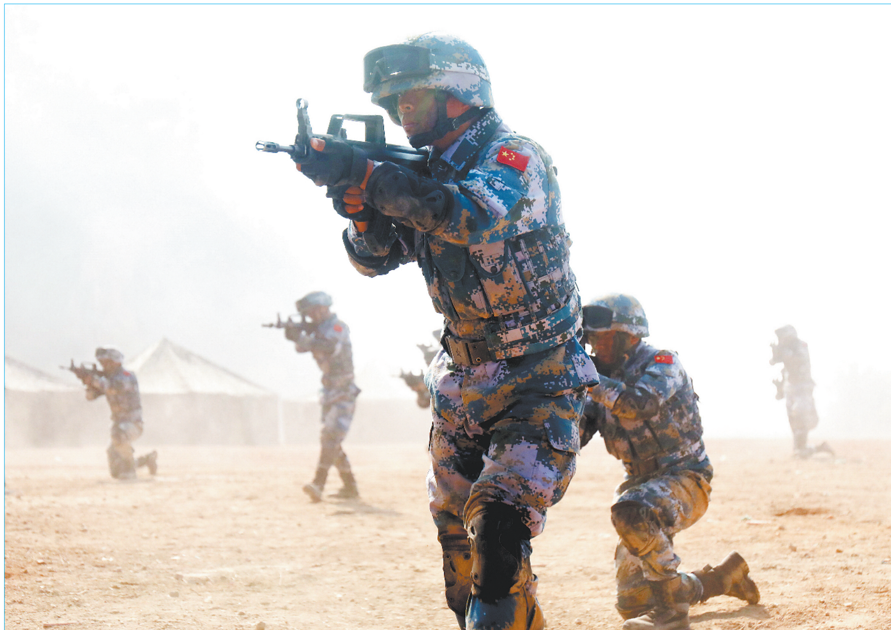
一招一式反复琢磨，让新兵身上的血性胆气呼之欲出。