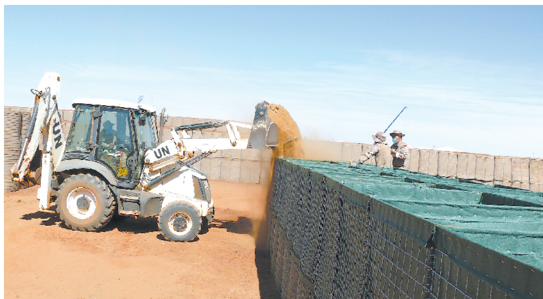
日前，经过紧张施工，我第8批赴马里维和工兵分队如期完成卡斯蒂营区一座维和友军弹药库的建设任务。

发言人说，谎言终将揭穿，公道自在人心。中央统战部的活动都是在阳光下堂堂正正开展的。无论蓬佩奥等反华政客抛出多少所谓“阴谋论”、“渗透论”等荒唐谬论，中国共产党团结一切可以团结的力量致力于中华民族伟大复兴的目标都不会改变；中国党和政府增进与世界各国人民的友好交往，致力于维护世界和平与发展，共同构建人类命运共同体的努力都不会改变。