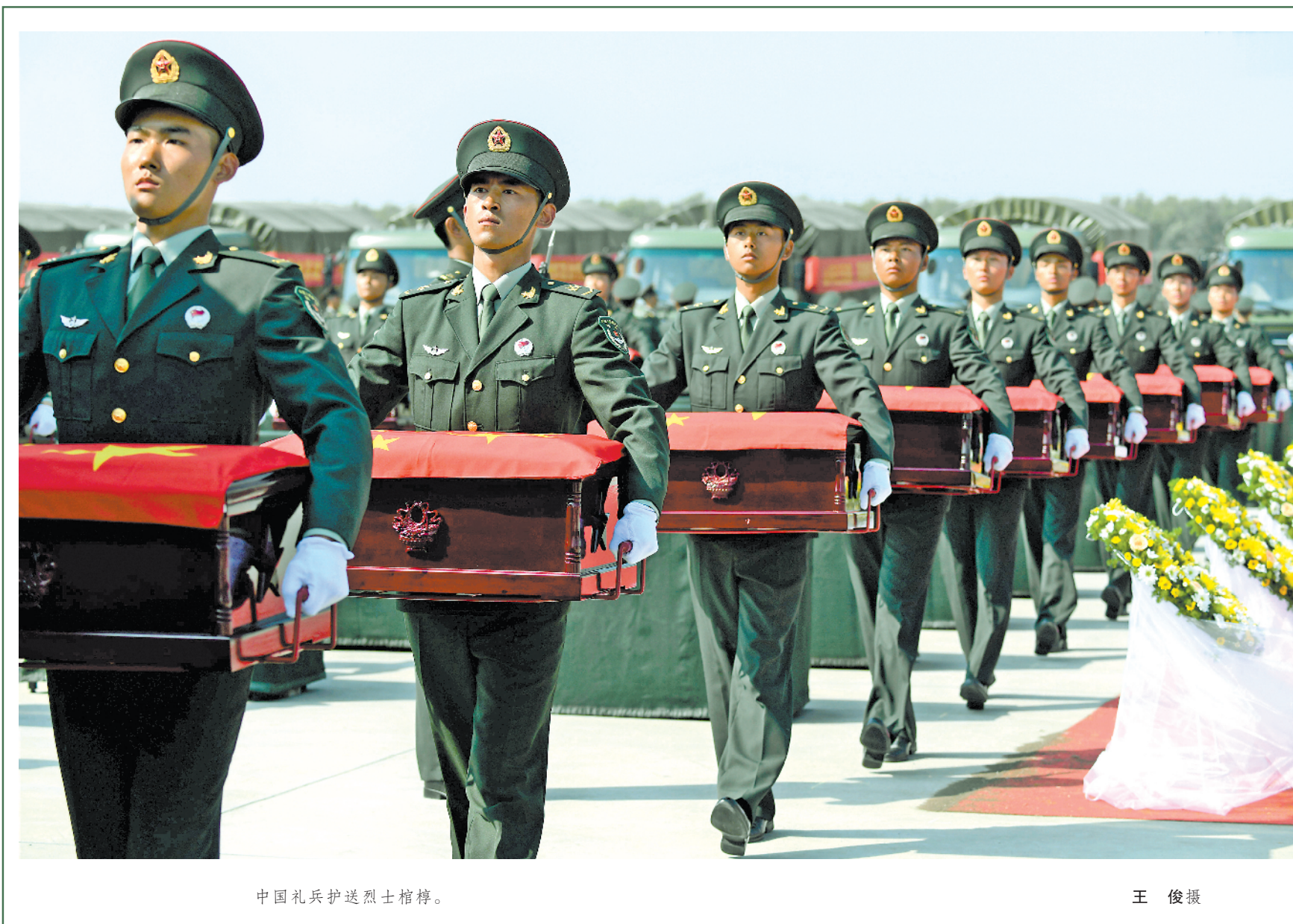
中国礼兵护送烈士棺椁。