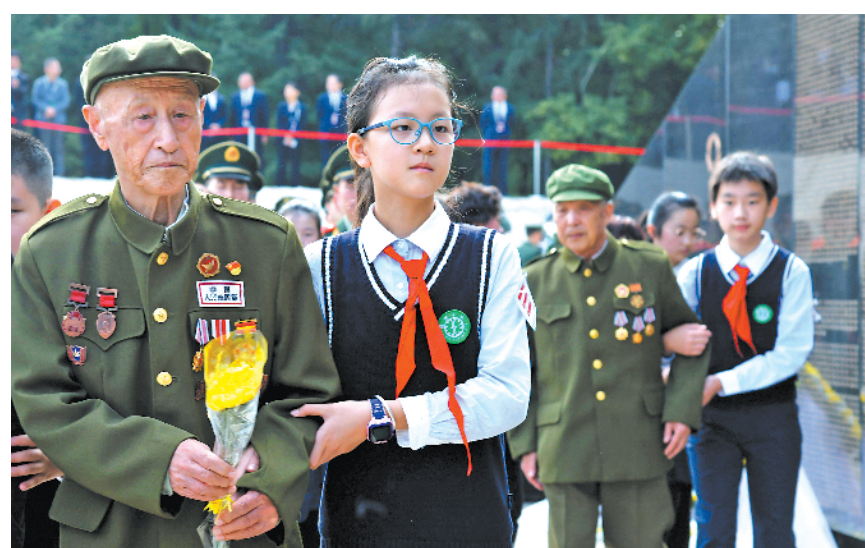
志愿军老战士向烈士敬献鲜花。