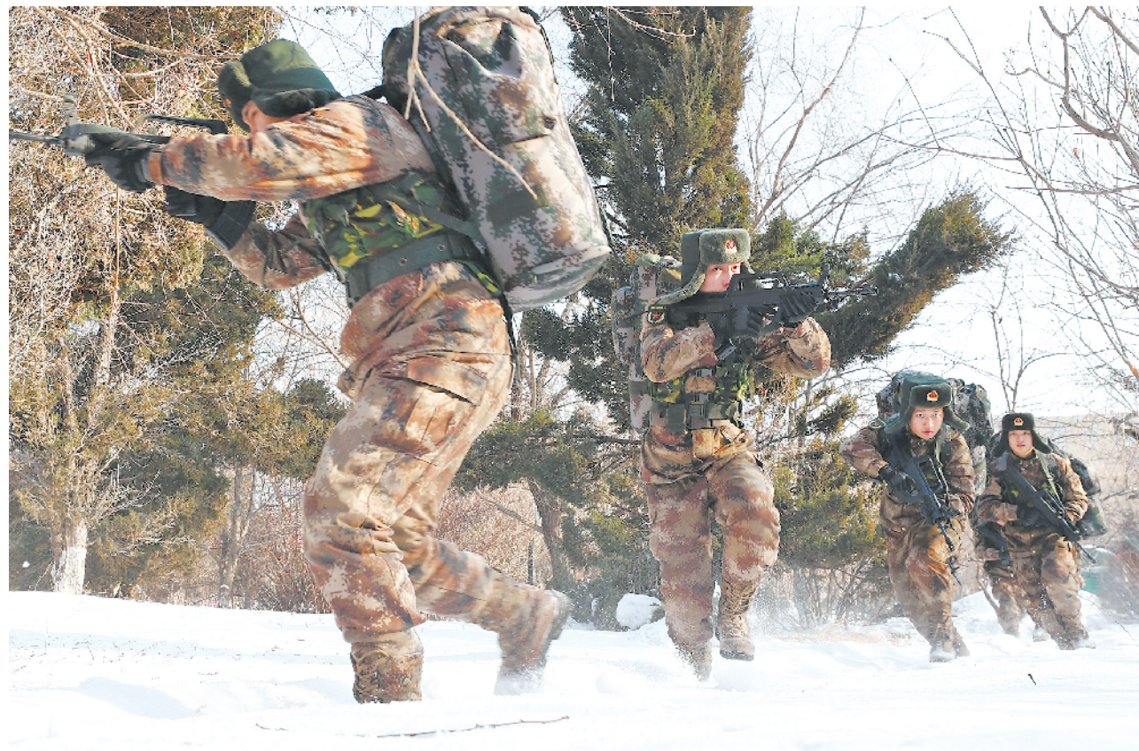
1月上旬，黑龙江省军区组织首长机关和所属单位现役官兵、文职人员奔赴训练场，拉开新年度实战化练兵序幕。

前不久，在上级组织的教练员集训中，该团15人被评为优秀教练员，多份教案入选优质教案。