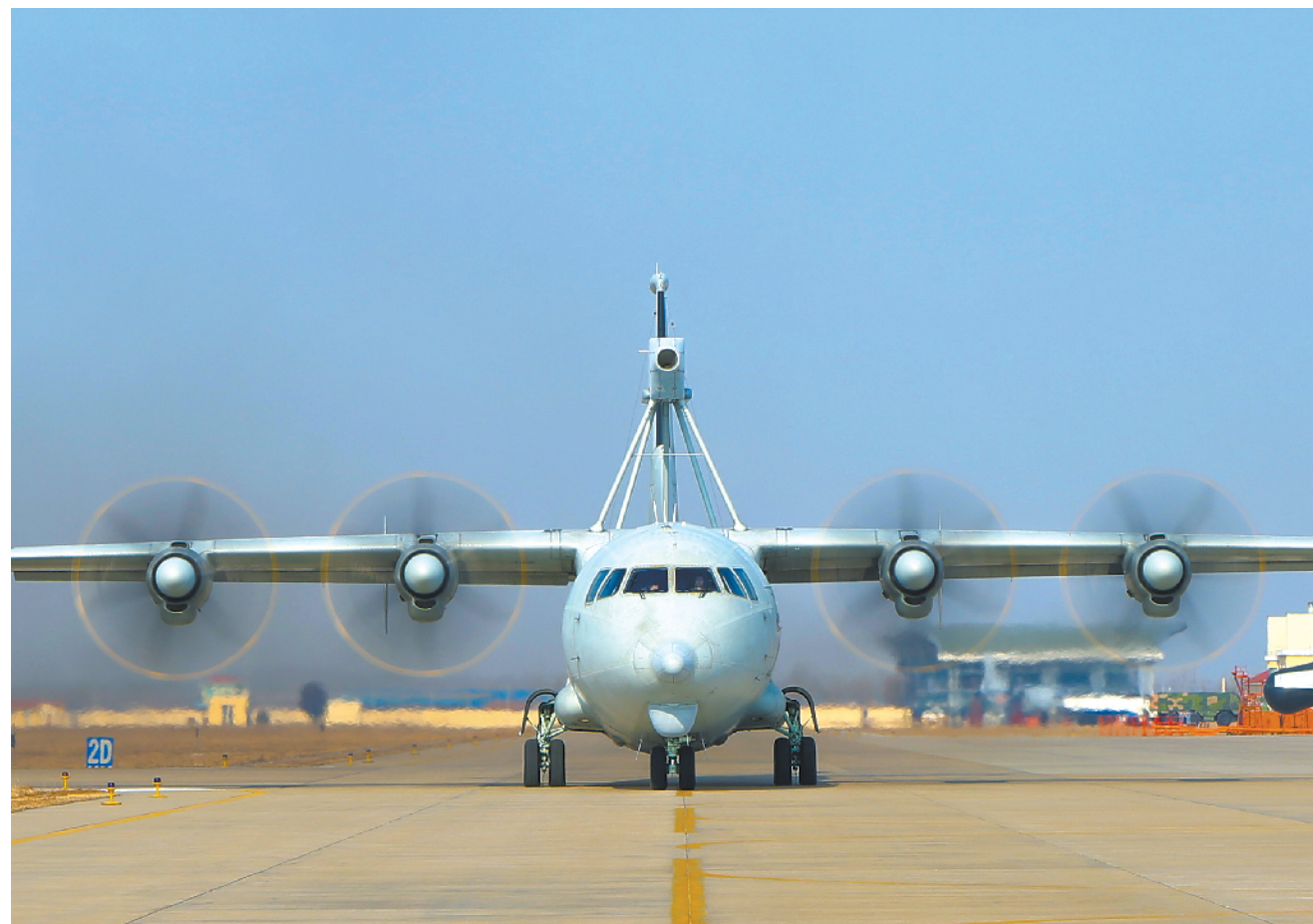
寒冬时节，海军航空兵某部组织跨昼夜飞行训练。