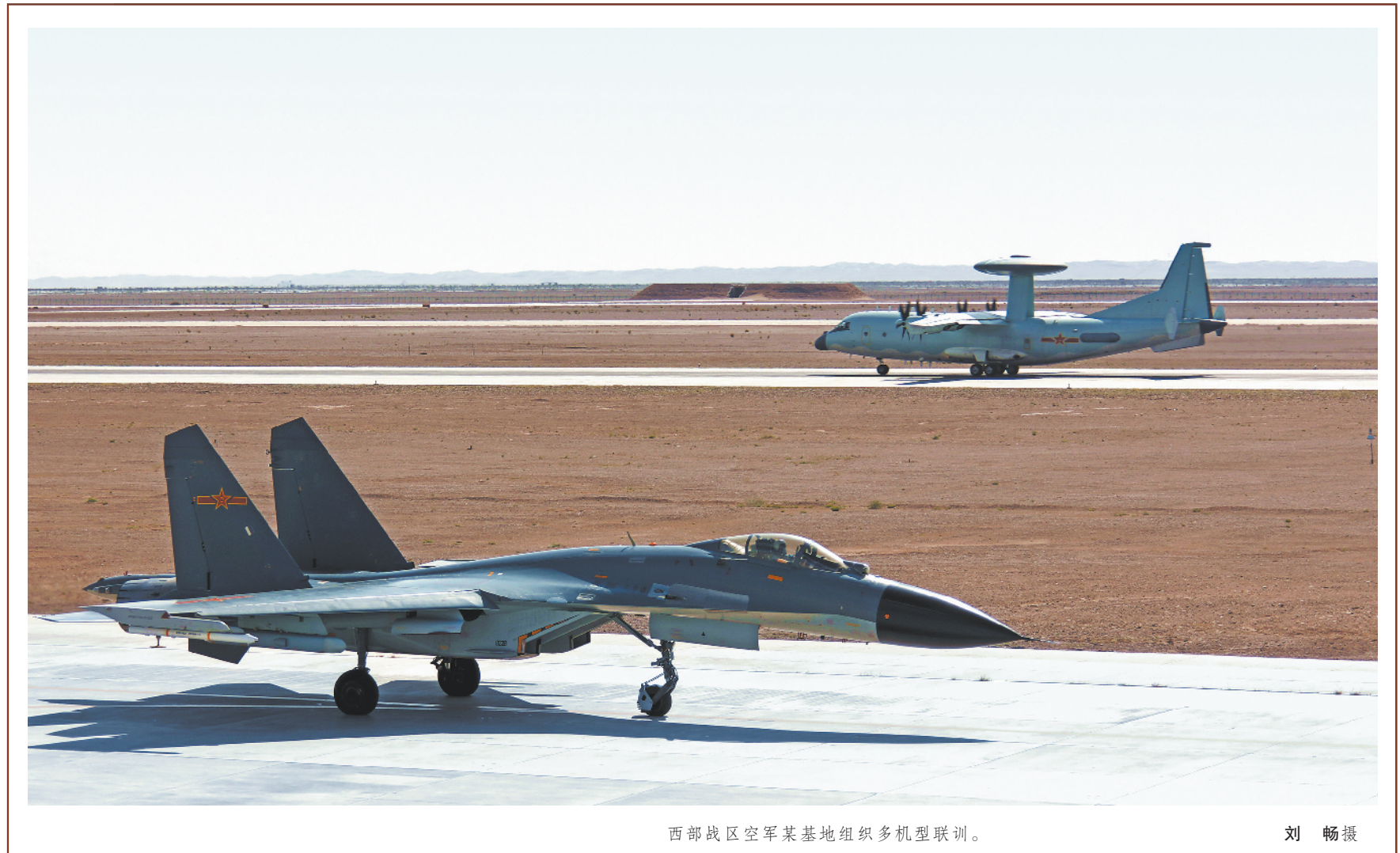
西部战区空军某基地组织多机型联训。

记者在该基地参谋部的《体系练兵安排表》上看到，仅2020年，他们“借势”组织的体系对抗演练就有10余项。这些不请自来的兄弟单位，成为最好的练兵背景。“各路好手、各种战法皆可为我‘磨刀’。”该基地领导说。