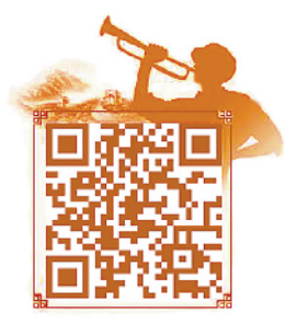
扫描二维码,网上参观中共一大会议纪念馆

横空大气排山去,砥柱人间是此峰。从石库门到天安门,从兴业路到复兴路,百年征程雄奇壮美,初心如磐历久弥坚。一个志在千秋伟业的政党,百年恰是风华正茂;一个牢记初心使命、奋进复兴征程的政党,必将傲然屹立时代潮头!