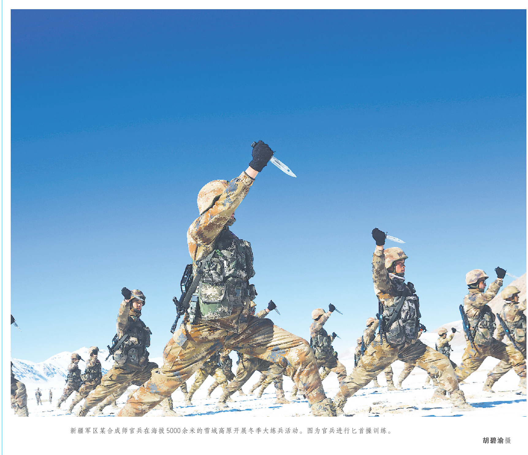
新疆军区某合成师官兵在海拔5000余米的雪域高原开展冬季大练兵活动。图为官兵进行匕首操训练。

过去，某团机关为保障部队顺利过冬想了不少办法，板房、煤炭、保温篷布一趟趟运往驻训地，还有文化娱乐的投