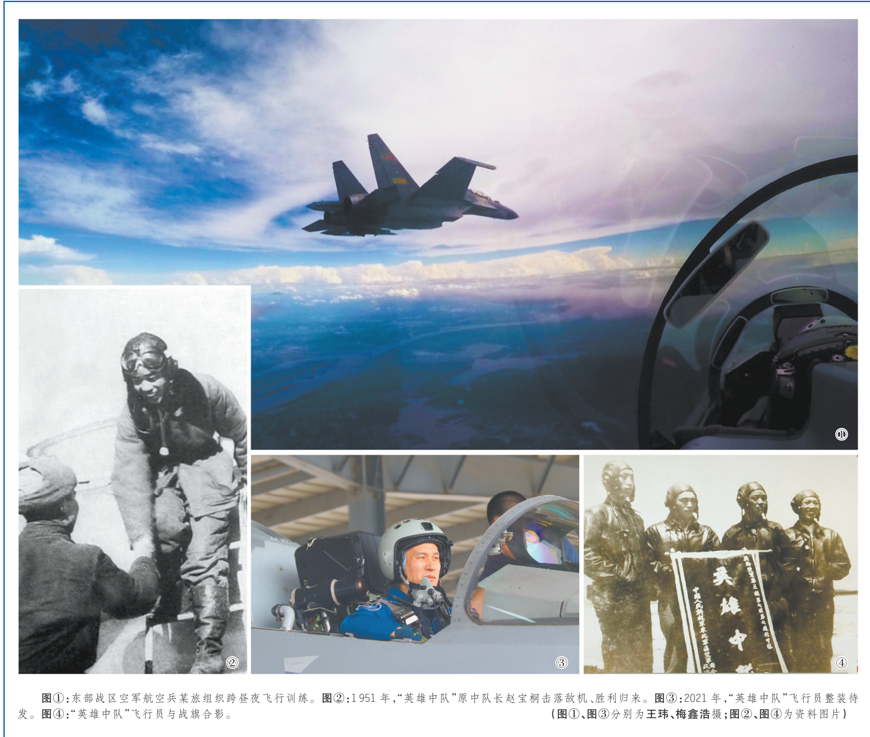
图①:东部战区空军航空兵某旅组织跨昼夜飞行训练。图②:1951年,“英雄中队”原中队长赵宝桐击落敌机、胜利归来。图③:2021年,“英雄中队”飞行员整装待发。图④:“英雄中队”飞行员与战旗合影。

凝视眼前年轻飞行员那一双双青春的脸庞,记者感叹,走过70年风雨征程的“英雄中队”,依然朝气蓬勃。为了胜