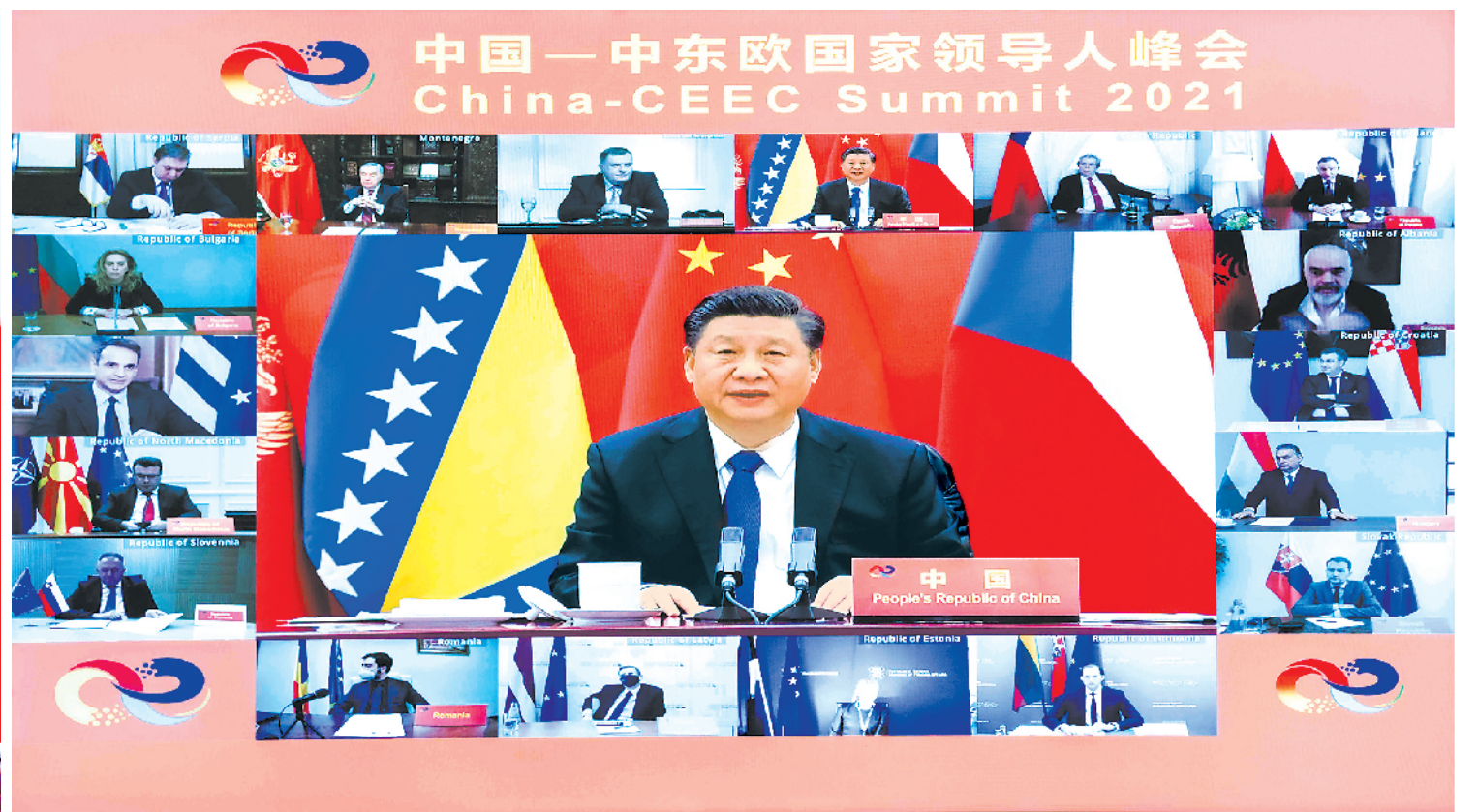
2月9日,国家主席习近平在北京以视频方式主持中国-中东欧国家领导人峰会,并发表题为《凝心聚力,继往开来 携手共谱合作新篇章》的主旨讲话。