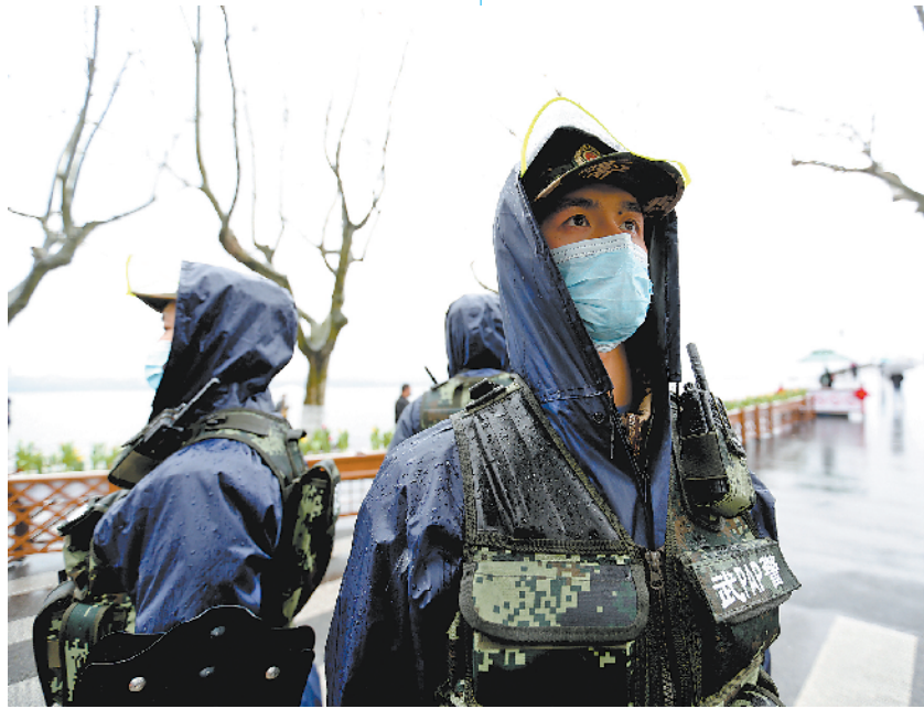
2021年2月11日,武警浙江总队杭州支队某中队官兵在西湖边站哨。