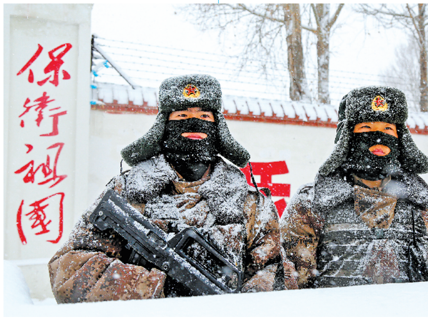
2021年春节前夕,康苏沟哨所官兵在严寒中站岗。