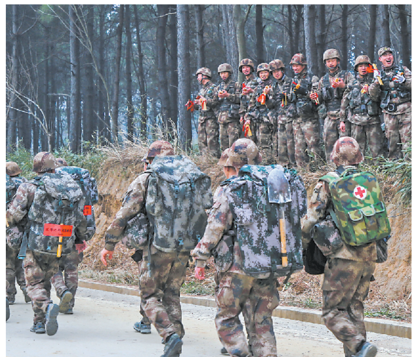
陆军第72集团军某旅在组织战斗体能训练中,注重发挥文艺骨干作用,组织宣传鼓动小组,通过快板、乐器演奏等形式为官兵加油鼓劲,提振士气。