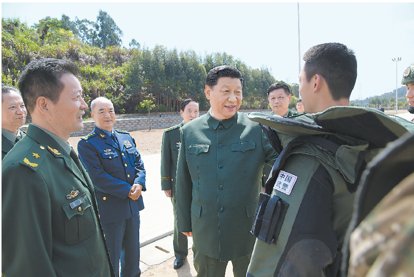
3月24日,中共中央总书记、国家主席、中央军委主席习近平到武警第二机动总队视察。这是习近平察看部队训练情况。