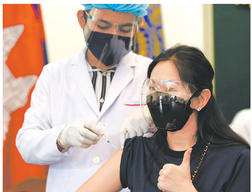
4月1日,柬埔寨开始为国民接种中国科兴新冠疫苗。图为一名女子在柬埔寨首都金边接种第一剂中国科兴新冠疫苗。