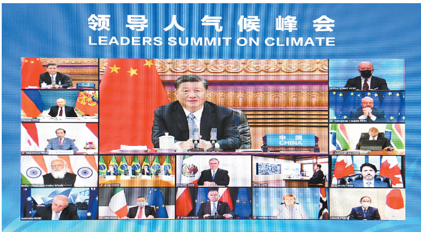
4月22日晚,应美国总统拜登邀请,国家主席习近平在北京以视频方式出席领导人气候峰会,并发表题为《共同构建人与自然生命共同体》的重要讲话。