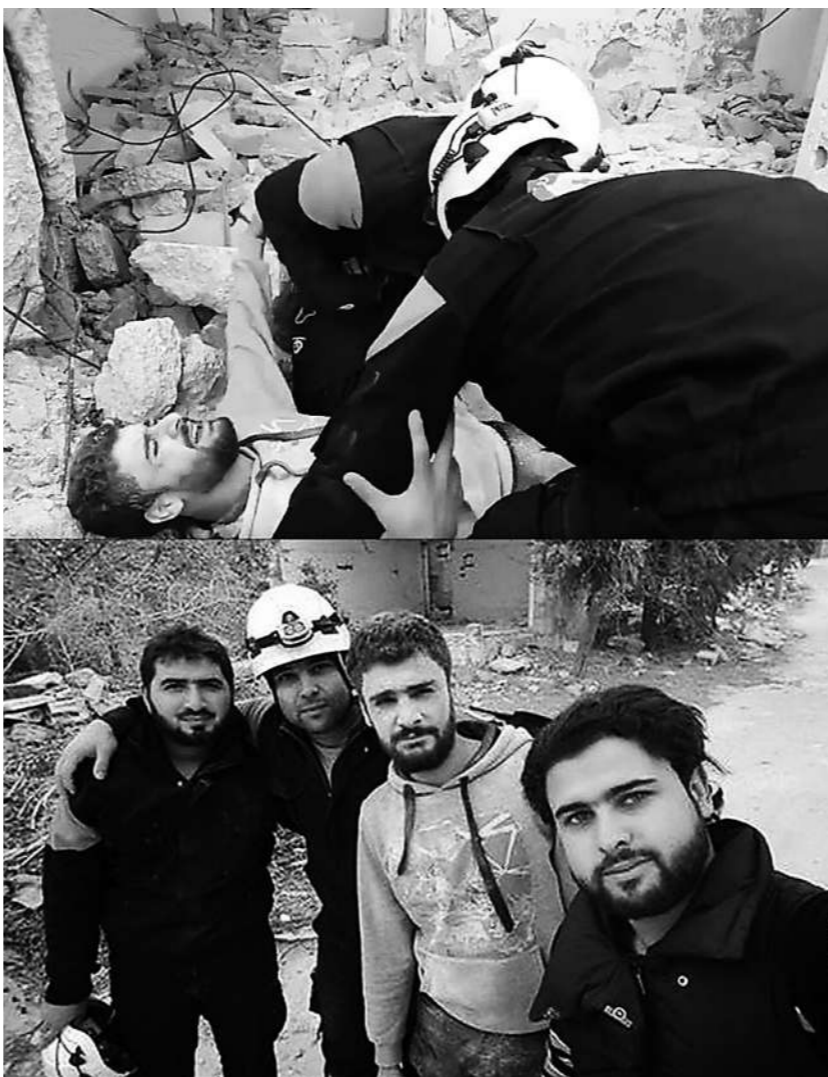
左图：“白头盔”组织在叙利亚进行虚假救援的现场。资料图片