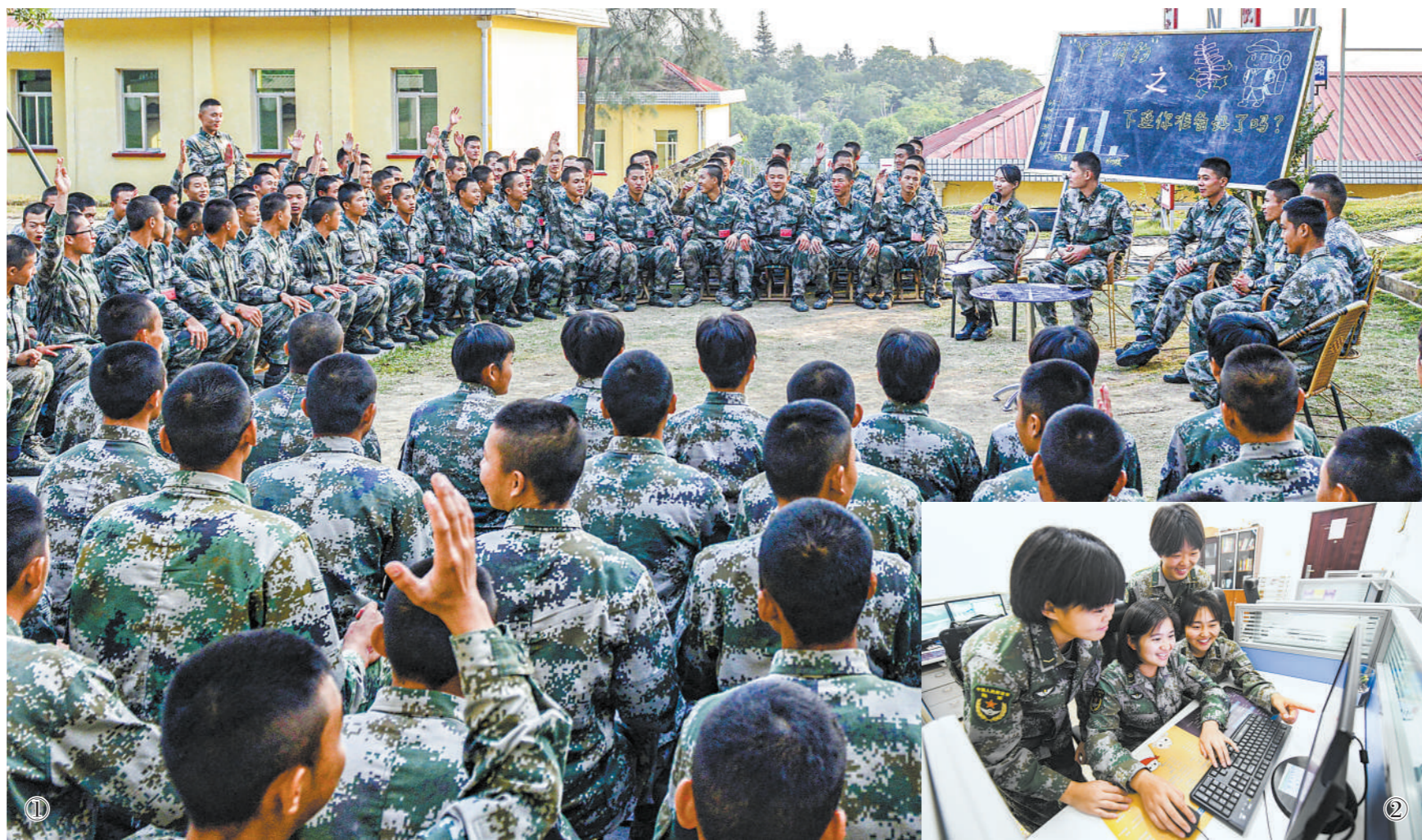
图①：不断走入官兵之中，使“丫丫有约”栏目长期保持活力与吸引力。图②：在见证官兵成长的同时，“丫丫”们自身也在成长。图为“丫丫”们在剪辑视频。