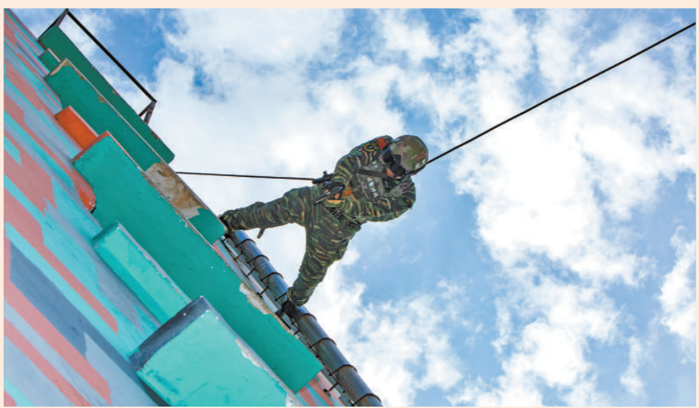
上图:5月28日,武警广西总队百色支队组织特战训练。