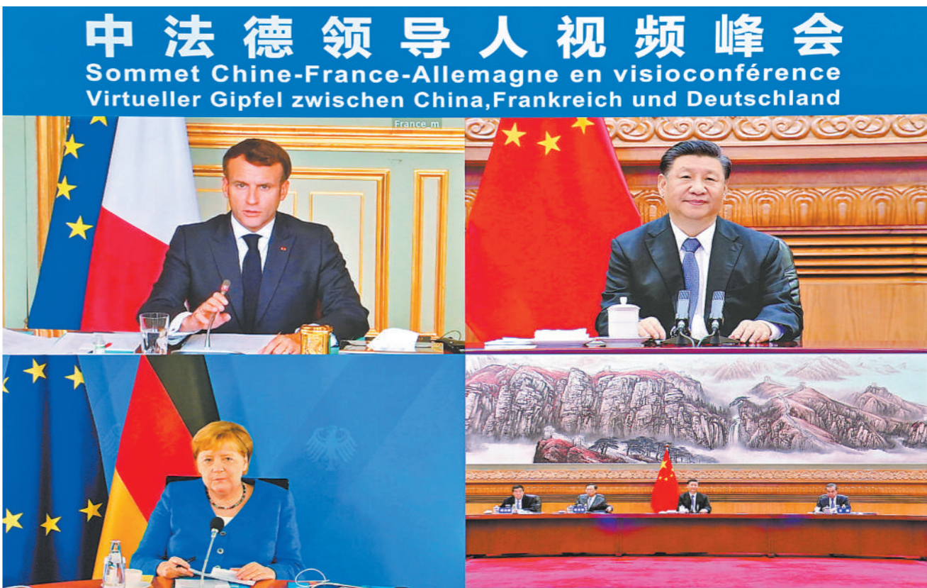
7月5日晚,国家主席习近平在北京同法国总统马克龙、德国总理默克尔举行视频峰会。

新华社北京7月5日电 国家主席习近平5日晚在北京同法国总统马克龙、德国总理默克尔举行视频峰会。