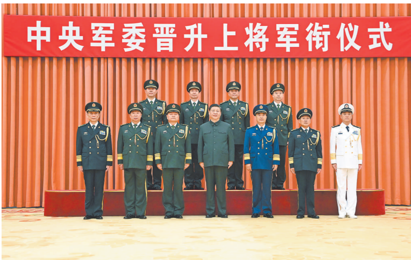
7月5日,中央军委晋升上将军衔仪式在北京八一大楼隆重举行。中央军委主席习近平向晋升上将军衔的军官颁发命令状。这是习近平等领导同志同晋升上将军衔的军官合影。

本报北京7月5日电 记者欧旭报道:中央军委晋升上将军衔仪式5日在北京八一大楼隆重举行。中央军委主席习近平向晋升上将军衔的军官颁发命令状。