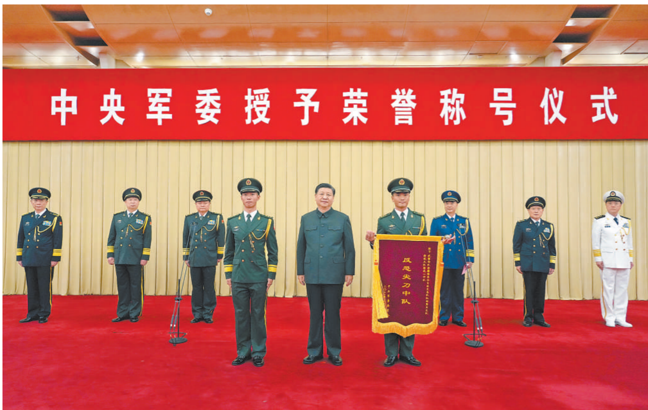
7月5日,中央军委授予荣誉称号仪式在北京隆重举行。中央军委主席习近平向获得“反恐尖刀中队”荣誉称号的武警部队新疆维吾尔自治区总队某机动支队特战大队特战1中队颁授奖旗,并同该中队代表合影留念。

本报北京7月5日电 记者欧旭报道:中央军委授予荣誉称号仪式5日在京隆重举行。中央军委主席习近平向获得荣誉称号的单位颁授奖旗。