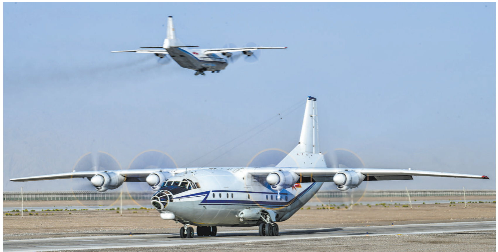
六月下旬，空降兵某旅开展实战化飞行训练。