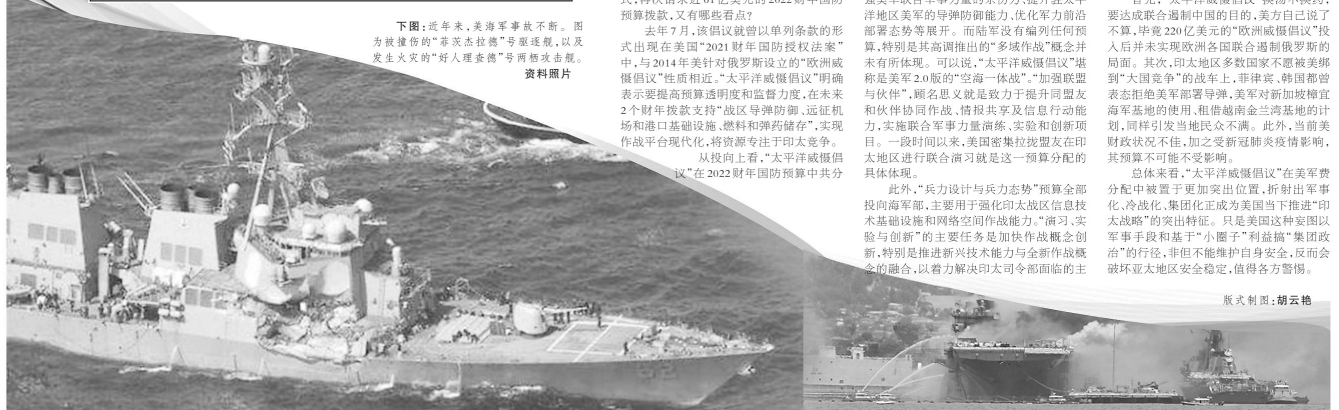
下图:近年来,美海军事事故不断。图为被撞伤的“菲茨杰拉德”号驱逐舰,以及发生火灾的“好人理查德”号两栖攻击舰。资料照片