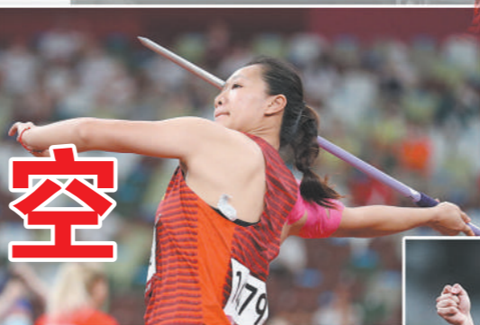
版式设计: 贾国梁 郑茂琦 刊头设计: 胡亚军 郭子涵

第三次参加奥运会的吕会会最被看好。这两年,她的状态也非常不错。2019年多哈世锦赛前,吕会会参加了大大小小的13场比赛,拿到12冠1亚的好成绩,多次刷新亚洲纪录。东京奥运会延期时,吕会会坚定地表示:“我唯一能做的就是走好眼前的每一步,一切自会水到渠成。”