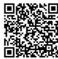
《昂扬志气，把稳前行之舵》(刊于八月五日《解放军报》)