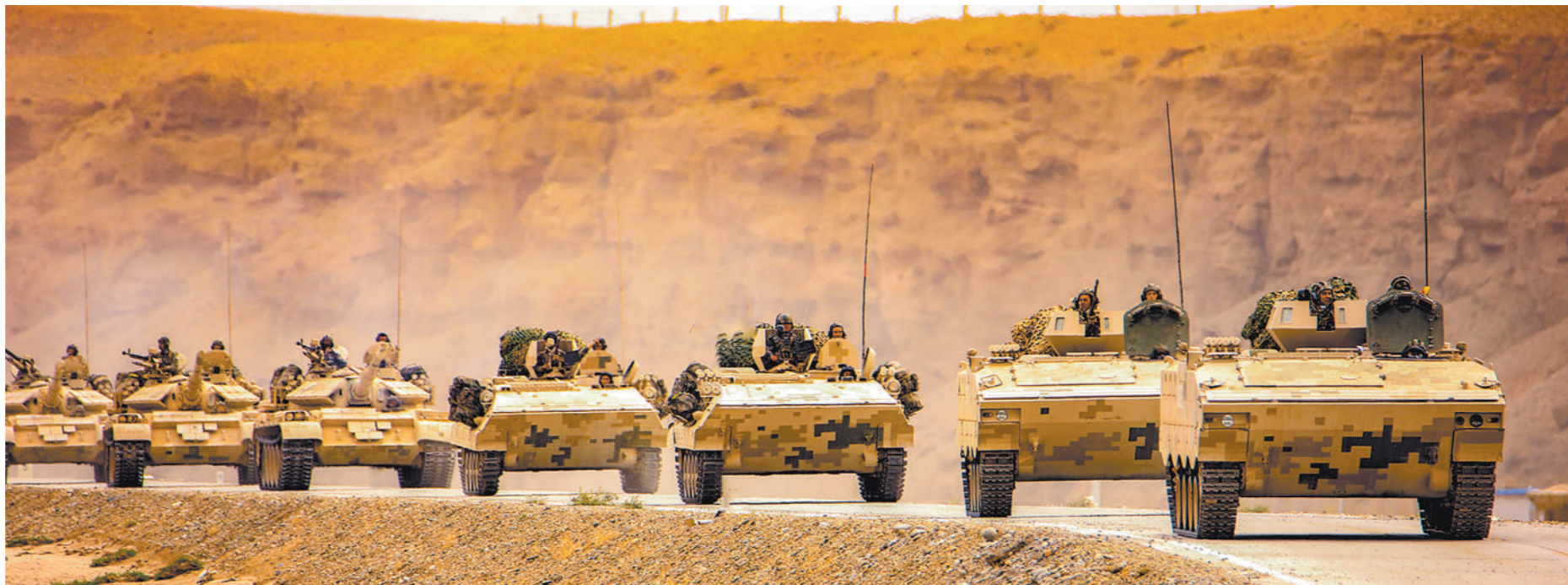
八月下旬,第七十七集团军某旅在大漠戈壁组织拉动演训。图为战车编队机动。

党的十九大和十九届二中、三、四、五中全会精神,紧紧围绕统筹推进“五位一体”总体布局和协调推进“四个全面”战略布局,始终把保护放在第一位,以系统完整保护传承城乡历史文化遗产和全面真实讲好中国故事、中国共产党故事为目标,本着对历史负责、对人民负责的态度,加强制度顶层设计,建立分类科学、保护有力、管理有效的城乡历史文化保护传承体系;完善制度机制政策,统筹保护利用传承,做到空间全覆盖、要素全囊括,既要保护单体建筑,也要保护街巷街区、城镇格局,还要保护好历史地段、自然景观、人文环境和非物质文化遗产,着力解决城乡建设中历史文化遗产屡遭破坏、拆除等突出问题,确保各时期重要城乡历史文化遗产得到系统性保护,为建设社会主义文化强国提供有力保障。 (二)工作原则 ——坚持统筹谋划、系统推进。坚持国家统筹、上下联动,充分发挥各级党委和政府城乡历史文化保护传承中的组织领导和综合协调作用,统筹规划、建设、管理,加强监督检查和问责问效,促进历史文化保护传承与城乡建设融合发展,增强工作的整体性、系统性。 ——坚持价值导向、应保尽保。以历史文化价值为导向,按照真实性、完整性的保护要求,适应活态遗产特点,全面保护好古代与近现代、城市与乡村、物质与非物质等历史文化遗产,在城乡建设中树立和突出各民族共享的中华文化符号和中华民族形象,弘扬和发展中华优秀传统文化、革命文化、社会主义先进文化。 ——坚持合理利用、传承发展。坚持以人民为中心,(下转第二版)