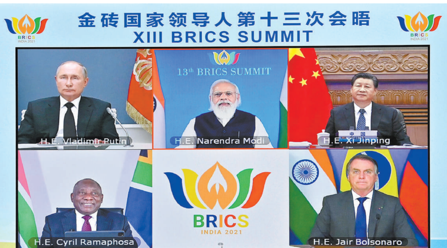
9月9日晚,金砖国家领导人第十三次会晤以视频方式举行。国家主席习近平在北京出席会晤并发表重要讲话。南非总统拉马福萨、巴西总统博索纳罗、俄罗斯总统普京出席,印度总理莫迪主持会议。

政治担当,支持彼此抗疫努力,分享疫情信息,交流抗疫经验。要在疫苗联合研发、合作生产、标准互认等领域开展务实合作,推动金砖国家疫苗研发中心在线上尽快启动。要加强传统医药合作,为抗击疫情提供更多手段。