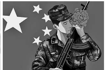
告别陪伴多年的“战友”