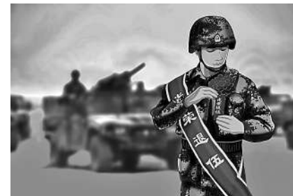
一朵红花告别军营青春