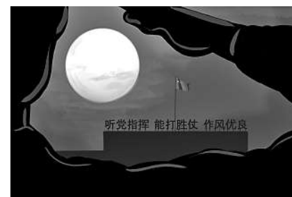
向着军旗再敬一次军礼