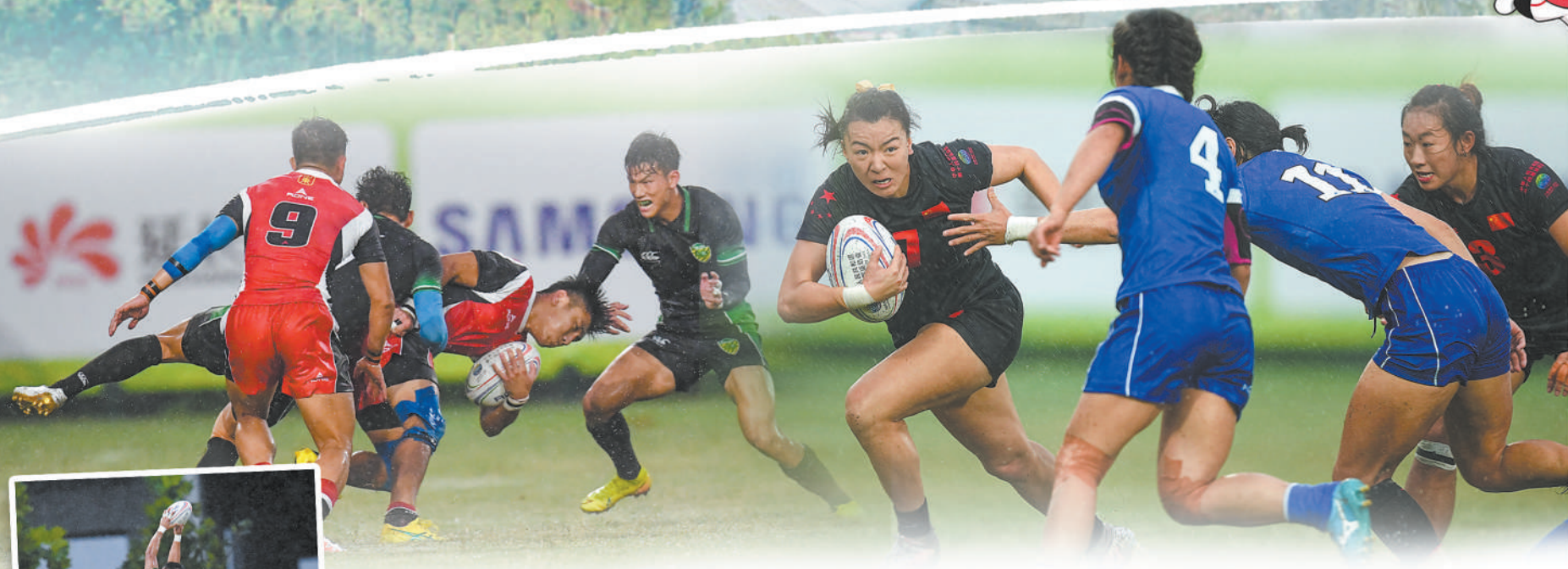
全运会橄榄球比赛落下帷幕,山东男队实现三连冠