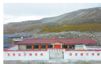
巴弄卓康哨所全景。

一家不圆万家圆。家人快乐是团圆、战友相聚是团圆、视频里互道平安也是团圆……头顶边关明月,身后万家灯火。这个中秋,让我们仰望坚守,感悟团圆。