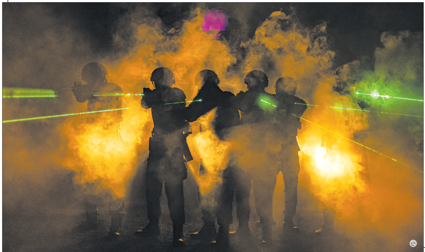
图①:狙击组伺机狙杀目标。 图②:战斗持续到深夜,特战队员迂回追剿“暴恐分子”。 图③:狙击组快速转移。 图④:特战队员在密林中搜索目标。