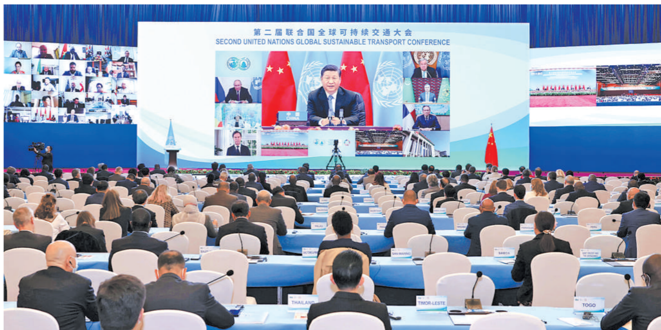
十月十四日晚,国家主席习近平以视频方式出席第二届联合国全球可持续交通大会开幕式并发表题为《与世界相交 与时代相通 在可持续发展道路上阔步前行》的主旨讲话。

新华社北京10月14日电 国家主席习近平14日晚以视频方式出席第二届联合国全球可持续交通大会开幕式并发表题为《与世界相交 与时代相通 在可持续发展道路上阔步前行》的主旨讲话。(讲话全文见第二版)