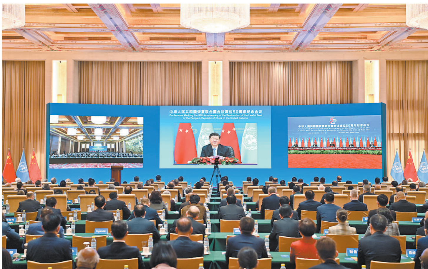
10 月 25 日,国家主席习近平在北京出席中华人民共和国恢复联合国合法席位 50 周年纪念会议并发表重要讲话。

新华社北京 10 月 25 日电 国家主席习近平 25 日在北京出席中华人民共和国恢复联合国合法席位 50 周年纪念会议并发表重要讲话。习近平强调,新中国恢复在联合国合法席位以来的 50 年,是中国和平发展、造福人类的 50 年。中国将坚持走和平发展之路,始终做世界和平的建设者;坚持走改革开放之路,始终做全球发展的贡献者;坚持走多边主义之路,始终做国际秩序的维护者。中国愿同各国秉持共商共建共享理念,弘扬全人类共同价值,践行真正的多边主义,站在历史正确的一边,站在人类进步的一边,为实现世界永续和平发展、为推动构建人类命运共同体而不懈奋斗。(讲话全文见第二版) 中共中央政治局常委、中央书记处书记王沪宁出席会议。