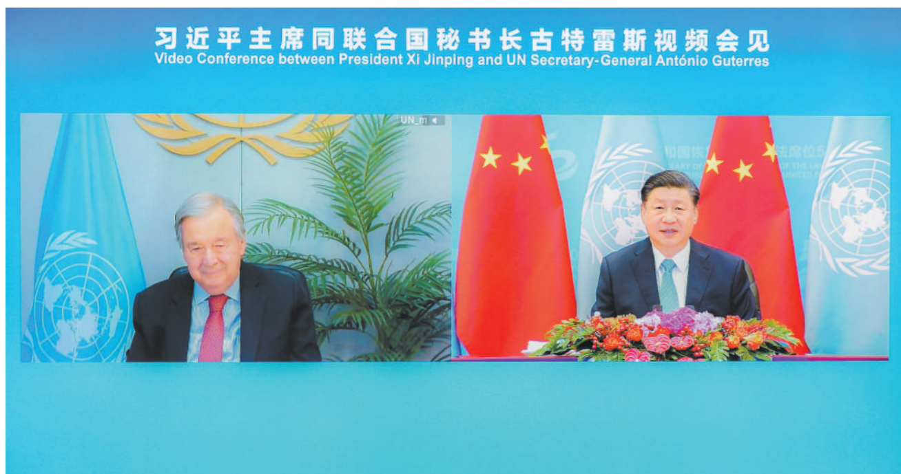
10 月 25 日上午,国家主席习近平在北京人民大会堂以视频方式会见联合国秘书长古特雷斯。

新华社北京 10 月 25 日电 国家主席习近平 25 日上午在北京人民大会堂以视频方式会见联合国秘书长古特雷斯。中共中央政治局常委、中央书记处书记王沪宁参加会见。 习近平指出,今天是中国恢复在联合国合法席位 50 周年。中国举办纪念会议,既是为了回顾中国和联合国共同走过的不平凡历程,也是为了从新的历史起点出发,携手打造更加美好的世界。 习近平强调,历史一再证明,无论一个国家多么强大,(下转第二版)