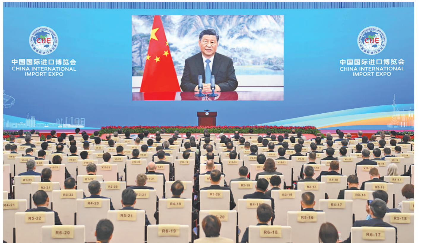
11月4日晚,国家主席习近平以视频方式出席第四届中国国际进口博览会开幕式并发表题为《让开放的春风吹暖世界》的主旨演讲。