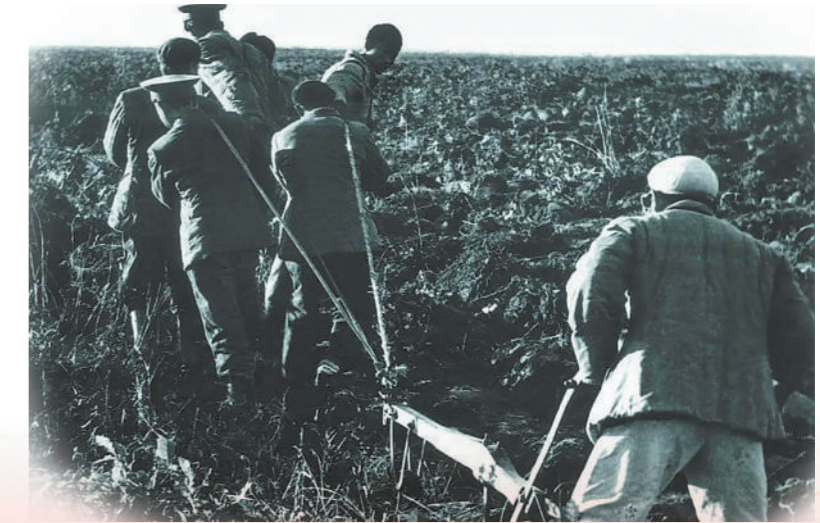
版式设计：方 汉 图片合成：孙 晨 图片由北大荒博物馆提供