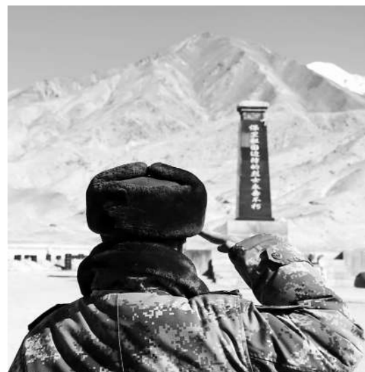
新疆军区某部官兵在康西瓦烈士陵园烈士纪念碑前庄严肃穆敬礼。