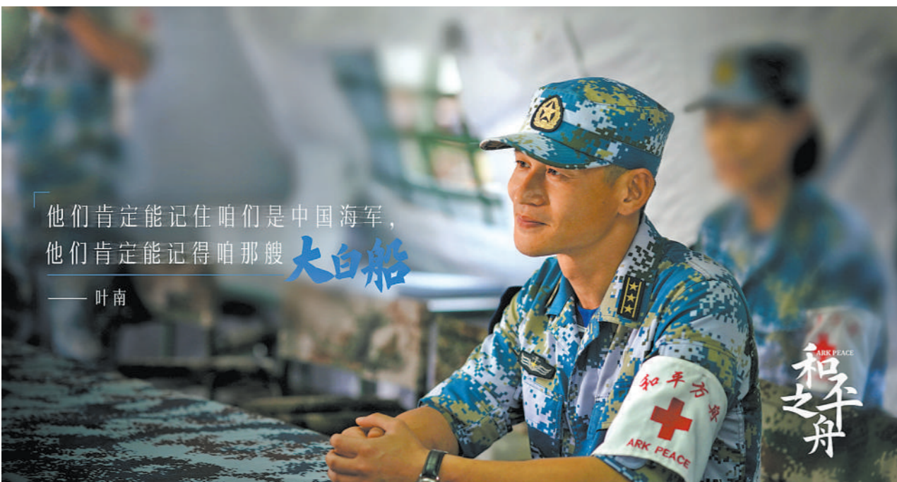
配图:电视剧《和平之舟》剧照。

作为一部反映新时代人民海军风采的作品,这部剧总体上是在国家和军队建设进入新时代、取得新发展的背景下,展示人民海军官兵在远海大洋和国际舞台上建功立业的故事。可以说,这是一部弘扬爱国主义和社会主义精神的军旅剧,一部反映人民海军医护人员仁心仁术的精彩剧,一部贯穿信仰信念、诠释初心使命的时代主旋律剧,值得一看。