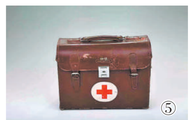
图①：西藏军区某部官兵在雪山上巡逻；图②：当年第18军进军西藏时的影像；图③：庆祝西藏和平解放70周年大会现场；图④：武警西藏总队组织官兵高原训练；图⑤：孔繁森生前使用的药箱。

但是这个小小的药箱始终盛满了深情，这深情是“老西藏精神”最朴素最真挚的表达，是一代又一代援藏干部在这座精神灯塔下开出的心灵之花。