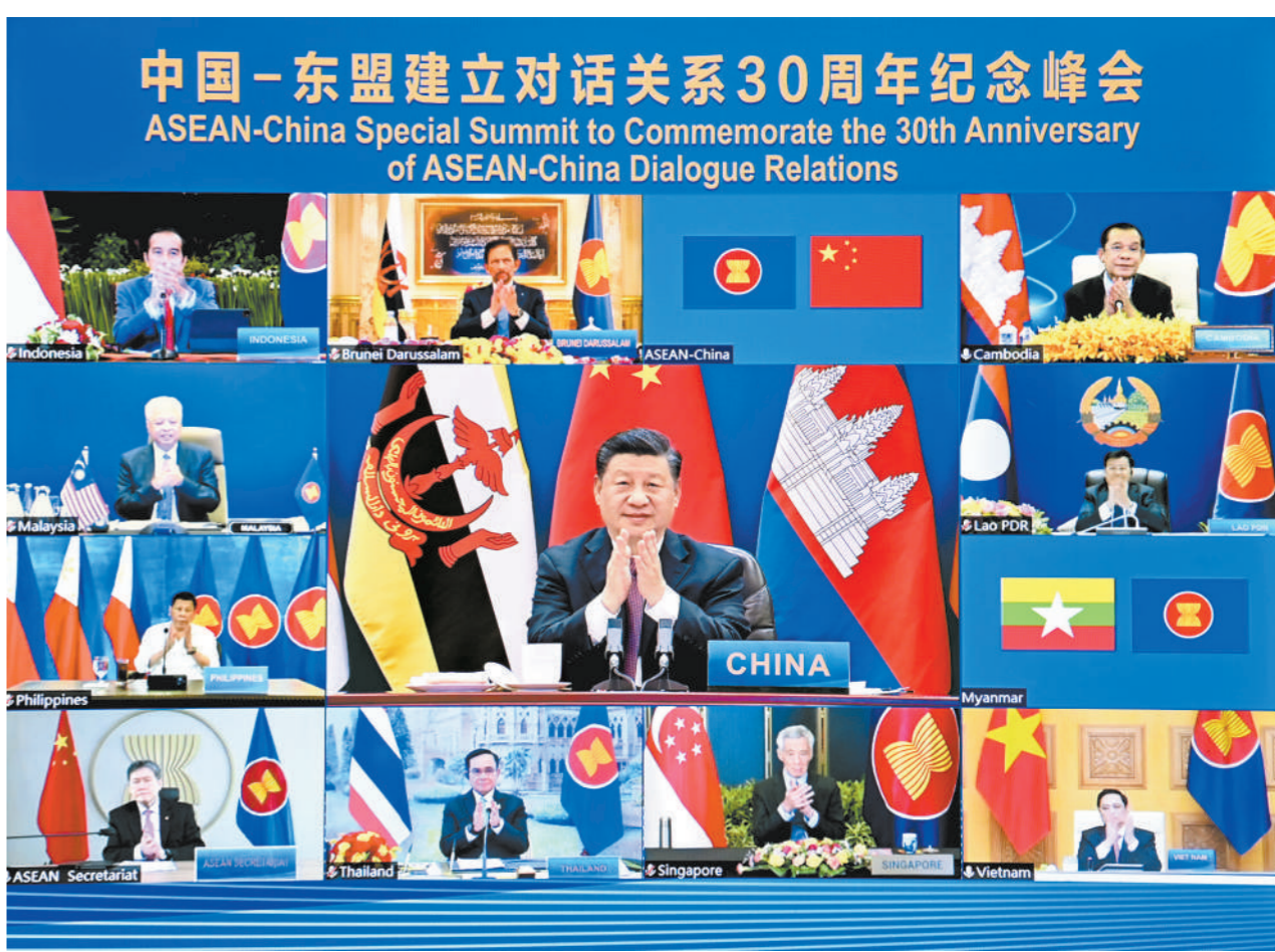
11月22日上午,国家主席习近平在北京以视频方式出席并主持中国-东盟建立对话关系30周年纪念峰会,发表题为《命运与共 共建家园》的重要讲话。中国东盟正式宣布建立中国东盟全面战略伙伴关系。

新华社北京11月22日电 (记者杨依军)国家主席习近平22日上午在北京以视频方式出席并主持中国-东盟建立对话关系30周年纪念峰会。中国东盟正式宣布建立中国东盟全面战略伙伴关系。